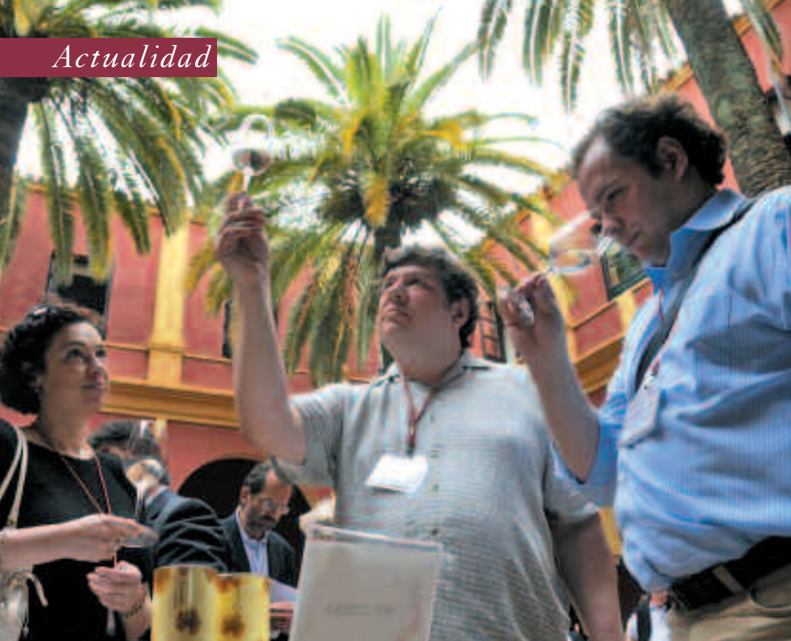
Un momento de la cata en el patio interior de la Hacienda Benazuza (Sanlúcar la Mayor, Sevilla), a la que por primera vez acudieron los mejores vinos blancos de España. Los jardines y alrededores de la piscina ayudaron a la concentración del trabajo de cata de los participantes, algunos de ellos venidos de tierras tan lejanas como Malasia.