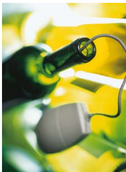
La compra de vino por Internet se ha convertido en una canal de comercialización con futuro.

Desde hace tiempo, Internet es un medio muy interesante para el aficionado al vino. En la Red se pueden comprar prácticamente todos los vinos del mundo. Lo que considero más arriesgado es la compra en sí, la seguridad a la hora de seleccionar unos vinos sin saber en qué condiciones de conservación están, las garantías de privacidad en el pago, los plazos de entrega... Porque existen infinidad de tiendas en la Red y es difícil saber elegir ¿Qué normas básicas debería seguir para que mi compra no sea un fracaso?