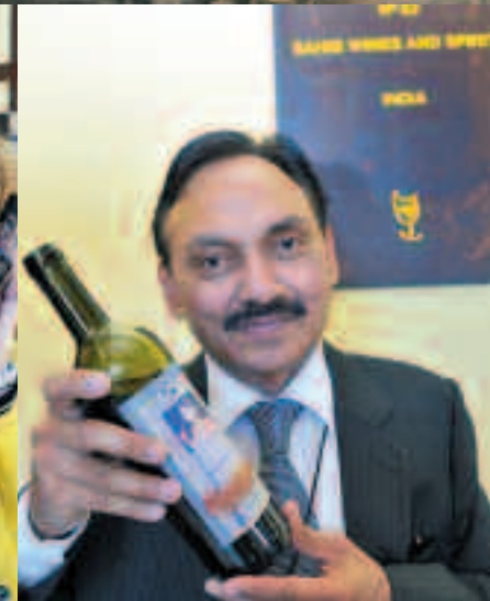
Arriba a la izda., dos cocineros chinos, preparando una de las "armonías sublimes", ésta con Sauternes y Tokay. A su derecha, cata vertical de Aleatico d'Elba, en la Torre del Homenaje. A la izquierda, uno de los stands de Grecia, país invitado este año. A su derecha, representante de la India, país que participaba por primera vez.