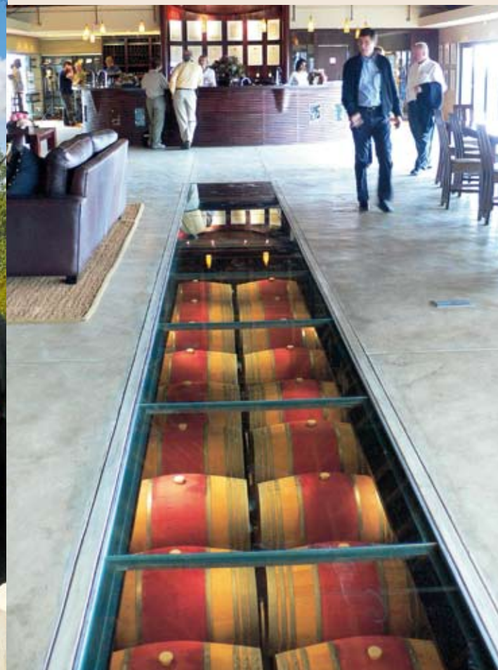
Sudáfrica: nueva generación de viticultores. Pág.44