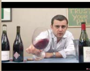
Catas originales y divertidas para cambiar el mundo del vino.