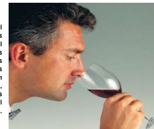
Siguiendo el ejemplo de los jugadores de fútbol y de las estrellas de Hollywood, los catadores famosos ya empiezan a asegurarse, con contratos millonarios, el sentido del olfato.

Son muchos los famosos que aseguran partes de su cuerpo fundamentales para el desarrollo de su actividad. Son los denominados «seguros extraordinarios». Por ejemplo, algunos cantantes tienen aseguradas sus cuerdas vocales. Pero no sólo los famosos tienen acceso a estas pólizas; cada vez son más los profesionales (cirujanos, enólogos, músicos...) que suscriben seguros especiales para «blindar» aquellos elementos que consideran fundamentales para su trabajo. En el mundo del vino, el caso más sonado es del bodeguero y catador holandés Ilja Gort, propietario del Château de la Garde (Burdeos), que ha asegurado la pérdida de su nariz o su sentido del olfato por cinco millones de euros en la aseguradora londinense Lloyd's. Lo hizo tras enterarse de que un hombre había perdido el sentido del olfato en un accidente automovilístico. El contrato incluye una singular lista de cláusulas: no puede conducir una moto ni ser boxeador, asistente de lanzador de cuchillos o tragafuegos.