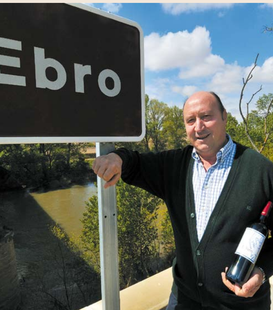
Ríos de vino: el Ebro. Pág.18