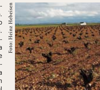
Viñas viejas cultivadas mediante poda en vaso.

tivo en vaso suele ser manual y el empleo de maquinaria está muy limitado. Por eso, el sistema Gobelet es sinónimo de viticultura extensiva y muy laboriosa. Mientras que con el cultivo en espaldera los racimos cuelgan a cierta distancia del suelo y en la zona de los racimos se pueden podar las hojas antes de la vendimia, con la poda en vaso, que asemeja la cepa a un arbusto, los racimos crecen en el interior del follaje y más cerca del suelo, debido a lo cual las uvas tardan más en secarse en caso de lluvia.